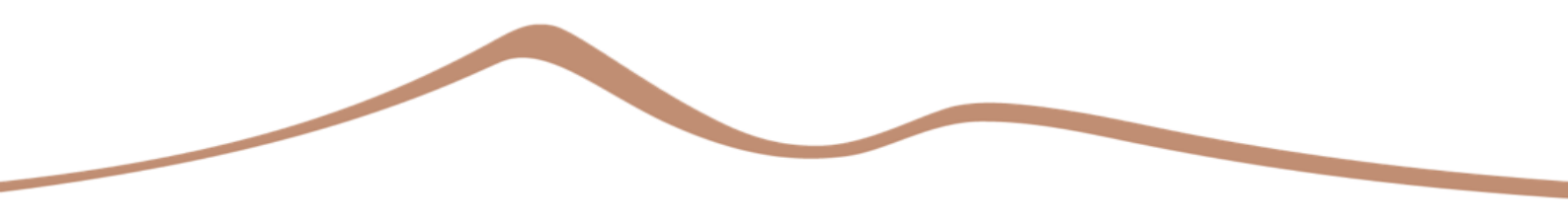
График работы: сменный, выходные – согласно графику

Сертификат: «Физиотерапия» (срок действия до 14.05.2024 г.)